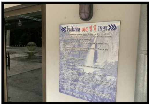
รูปที่ 2-5 ป้ายนโยบายสิ่งแวดล้อม