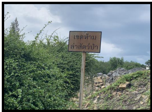
รูปที่ 2-9 ป้ายห้ามล่าสัตว์ป่า