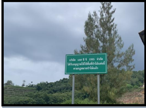
รูปที่ 2-17 ป้ายอนุญาตใช้พื้นที่ป่าไม้