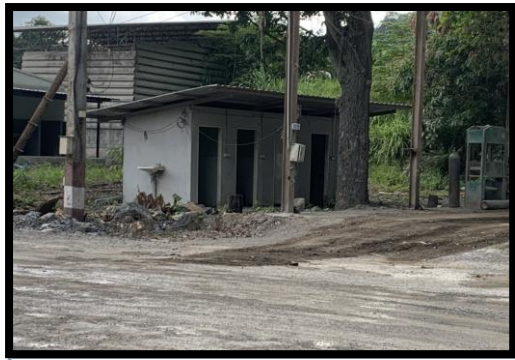
รูปที่ 2-19 ห้องน้ำ