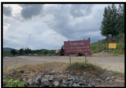
รูปที่ 2-15 ป้ายอันตรายพื้นที่ทำเหมือง