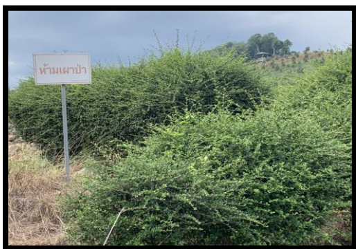
รูปที่ 2-13 ป้ายห้ามเผาป่า