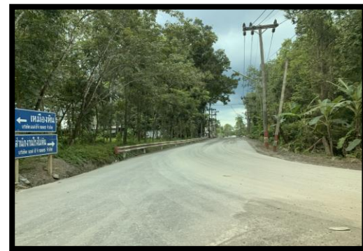
รูปที่ 2-6 ถนนเข้าเหมือง