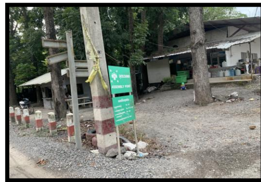
รูปที่ 2-16 จุกรวมพล