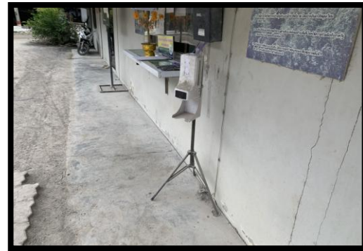
รูปที่ 2-36 ที่วัดอุณภูมิ