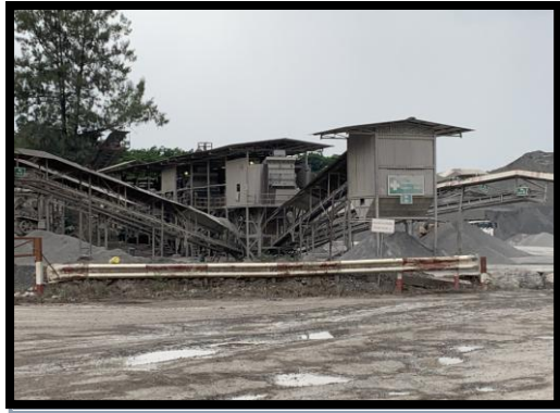
รูปที่ 2-1 โรงโม่ระบบปิด