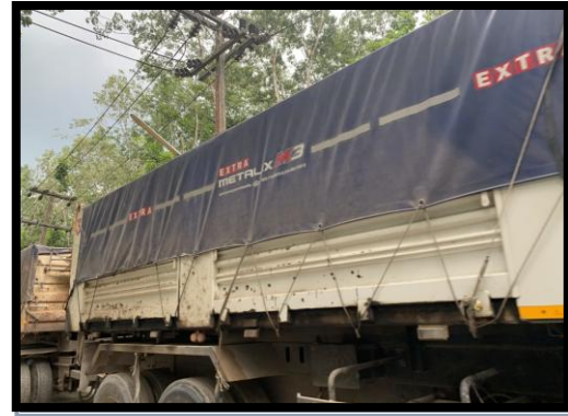
รูปที่ 2-2 รถขนส่งแร่