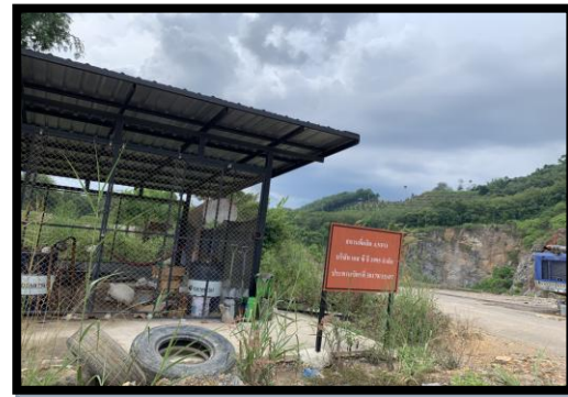
รูปที่ 2-32 สถานที่ผลิต AN-FO