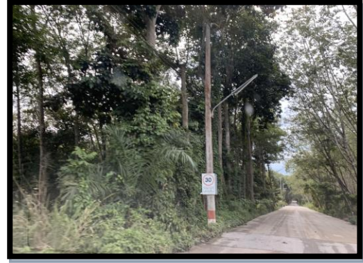
รูปที่ 2-18 ป้ายจำกัดความเร็ว