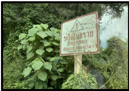
รูปที่ 2-3 ป้ายเตือนรถบรรทุก