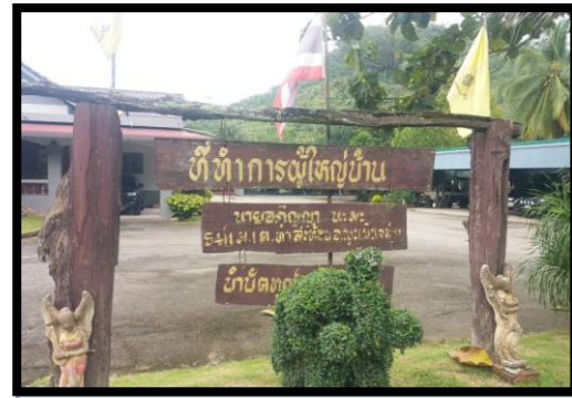
รูปที่ 2-30 ป้ายประชาสัมพันธ์บ้านผู้ใหญ่นบ้าน