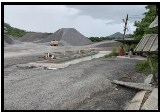
รูปที่ 2-11 ลานกองแร่