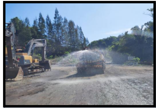
รูปที่ 2-20 รถขนส่งน้ำ