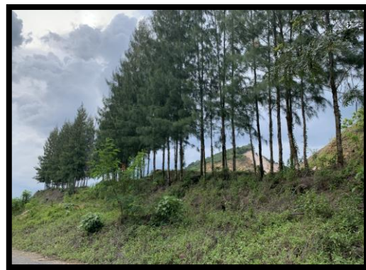
รูปที่ 2-10 แนวต้นไม้