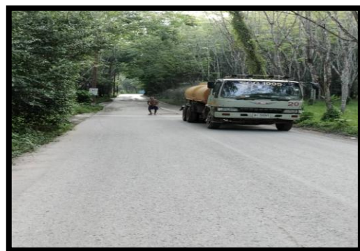
รูปที่ 2-14 การฉีดทำความสะอาดถนน