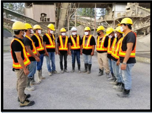
รูปที่ 2-25 อุปกรณ์ป้องกันอันตรายส่วนบุคคล