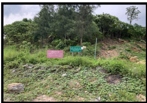
รูปที่ 2-7 ป้ายเตือนระเบิดหิน