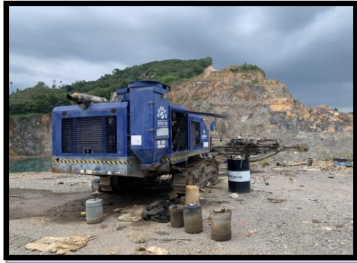
รูปที่ 2-33 รถเจาะแร่