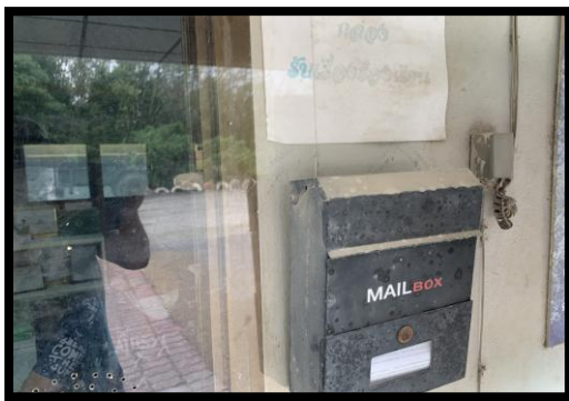
รูปที่ 2-31 ตู้รองเรียน