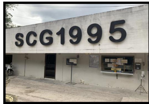
รูปที่ 2-40 สำนักงาน