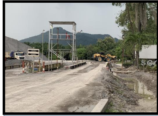
รูปที่ 2-26 ที่ซึ่งน้ำหนัก