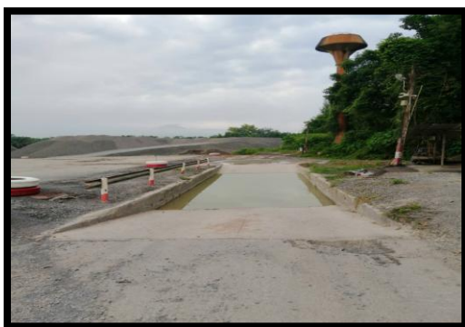
รูปที่ 2-39 ที่ล้างล้อรถ