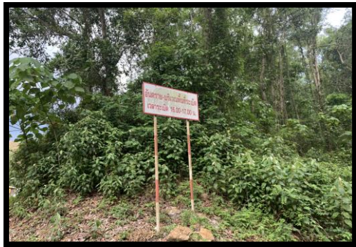
รูปที่ 2-35 ป้ายเตือนระเบิดหิน