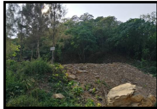
รูปที่ 2-38 บ่อดักตะกอน