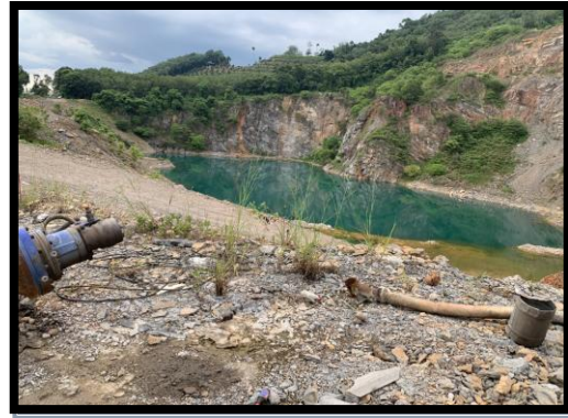
รูปที่ 2-34 ขุมเหมือง