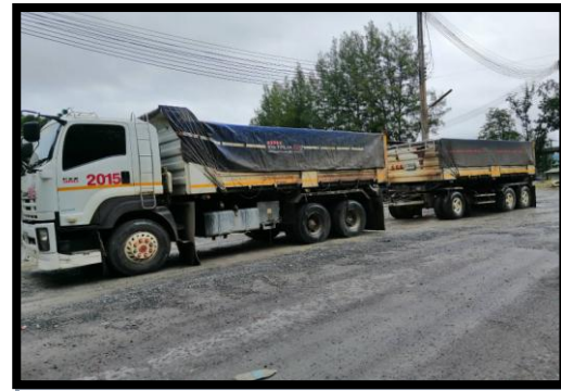
รูปที่ 2-28 รถขนส่งแร่คลุมฟ้าใบ