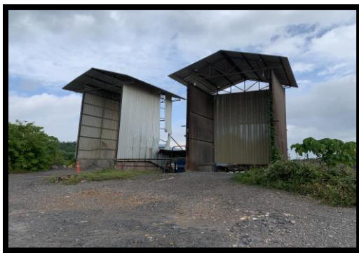
รูปที่ 2-23 ปากโม