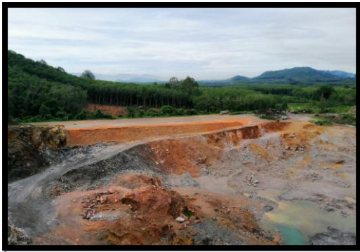
รูปที่ 2-27 บ่อตักตะกอน