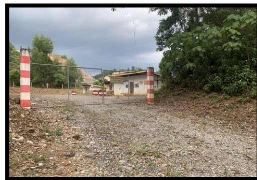
รูปที่ 2-12 อาคารเก็บวัตถุดิบ