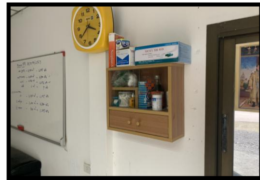
รูปที่ 2-4 ตู้ยา