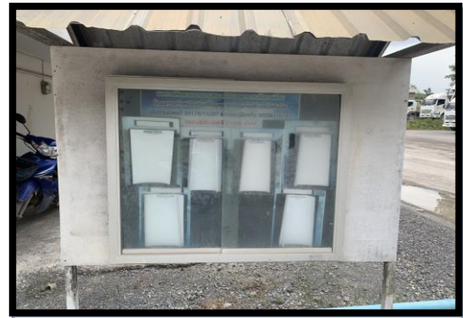
รูปที่ 2-22 ป้ายประชาสัมพันธ์