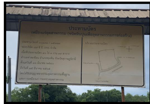
รูปที่ 2-8 ป้ายประทานบัตร