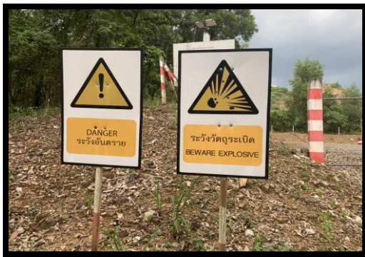
รูปที่ 2-21 ป้ายเตือนอันตรายวัตถุระเบิด