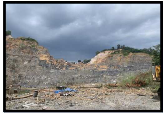
รูปที่ 2-24 บริเวณหน้าเหมือง